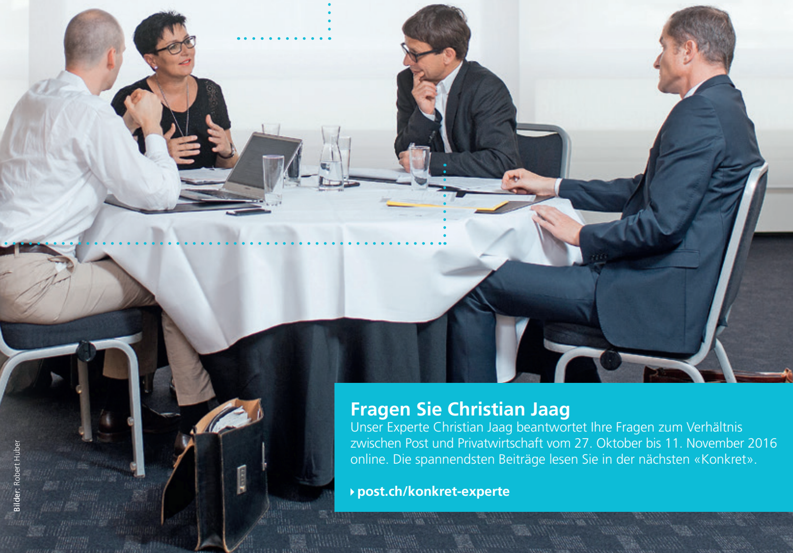
Round Table im Swissôtel Zürich