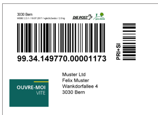
Exemple d'adresse d'expéditeur avec logo (réduit)