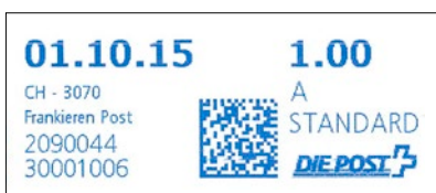
Esempio: sovrastampa del Servizio di affrancatura Posta

Con il Servizio di affrancatura Posta il vostro personale è esonerato da questi compiti e le sue competenze sono interamente messe a disposizione dell'azienda, a beneficio di attività generatrici di ricavi.