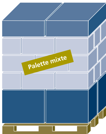
Étiquette «Palette mixte»

La surface de base de la palette Euro ne peut être dépassée. La marchandise ou l'emballage ne peut pas dépasser le bord de la palette.