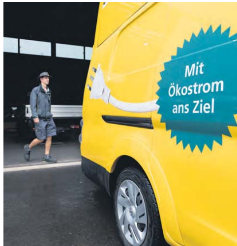
Les quatre véhicules à Hinwil sont propulsés à 100% avec du courant vert.