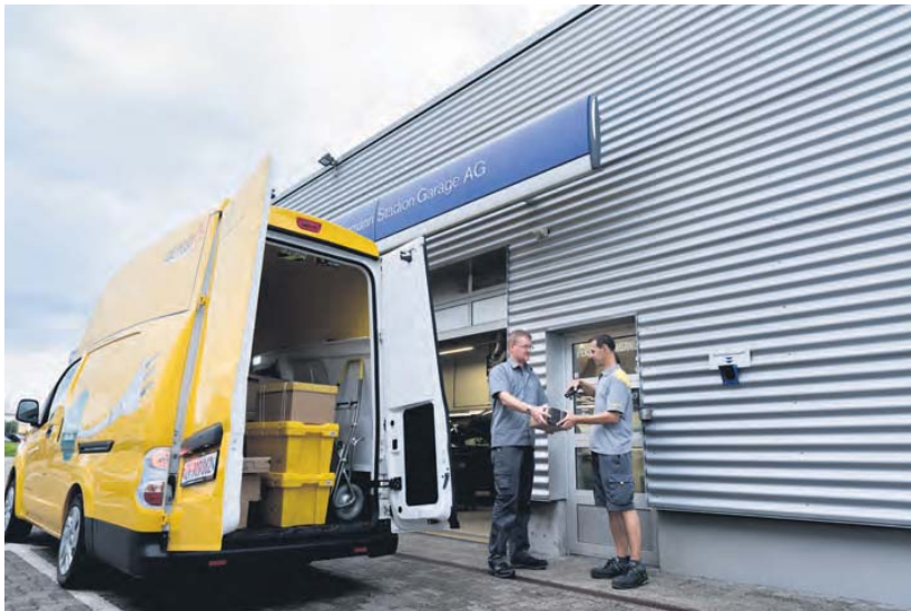
Premier arrêt: le garage Volvo pour une livraison de café Nespresso.