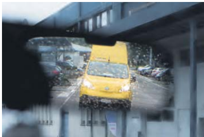
La tournée se poursuit malgré l'orage au-dessus de Wetzikon.