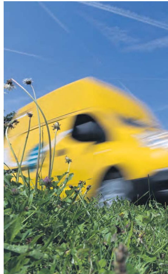
Le Nissan roule presque sans faire de bruit. Mais ses dimensions