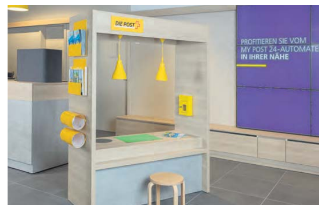
Le coin-jeux des enfants.

en valeur à Interlaken. L'expérience client dans la filiale-test sera complétée par deux nouveautés supplémentaires: un accès gratuit à Internet et un coin-jeux pour les enfants. Si le succès est au rendez-vous, d'autres filiales suivront en 2018.