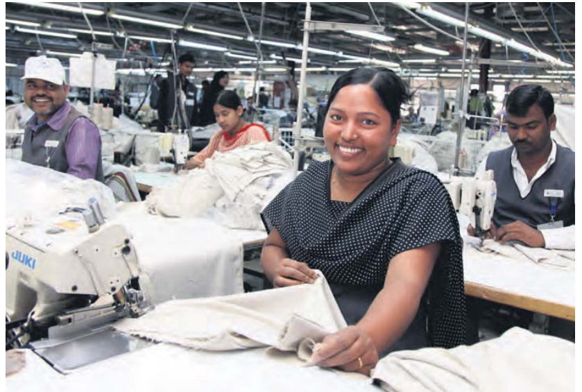
Production de vêtements en Jordanie.

Outre la distinction de la FWF, la Poste s'est aussi vu décerner un badge «Gold» par EcoVadis. EcoVadis est une agence de notation indépendante et reconnue au niveau international spécialisée dans le développement durable des entreprises. Pour leurs achats durables, les clients commerciaux misent de plus en plus souvent sur l'expertise de telles agences de notation afin d'évaluer la responsabilité entrepreneuriale de leurs fournisseurs, comme la Poste. ■