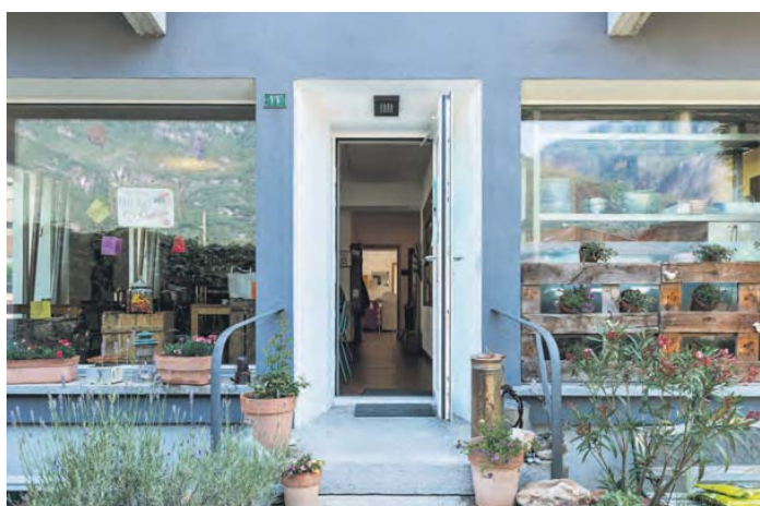
L'entrée accueillante du café et de l'agence postale.

café ou un apéritif lorsqu'ils sont de passage pour retirer un colis ou effectuer leurs paiements à la fin du mois, soit ils s'installent à table pour déguster les petits plats de Cornelia.