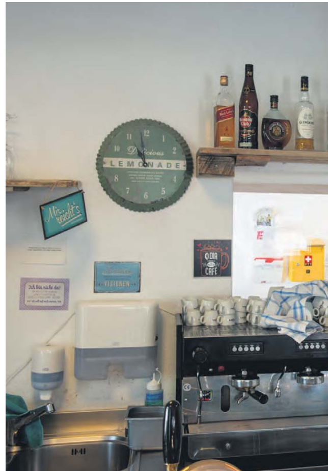
L'Ostello Cresciano met également à la disposition de ses clients un restaurant et une agence postale.