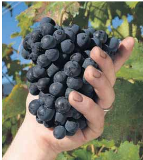
Une belle grappe prometteuse...

«Nous remplissons chaque année environ 10 000 bouteilles. Notre but est de doubler la production à 20 000 bouteilles, mais