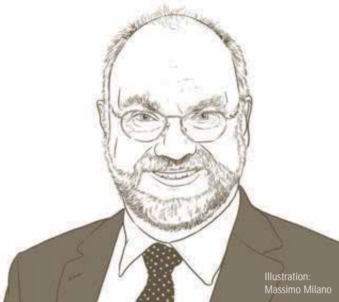
Illustration: Massimo Milano

Quand avez-vous envoyé votre dernière carte postale/lettre? Aujourd'hui.