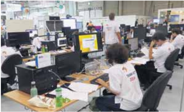
Concentration maximale lors des Swiss Skills.