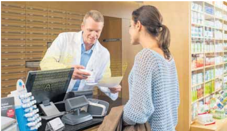
Le pharmacien a un aperçu de l'ensemble de la médication du patient.