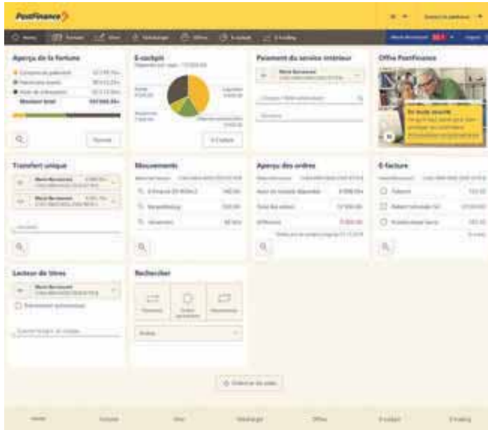
La nouvelle interface utilisateur, plus simple et plus claire.